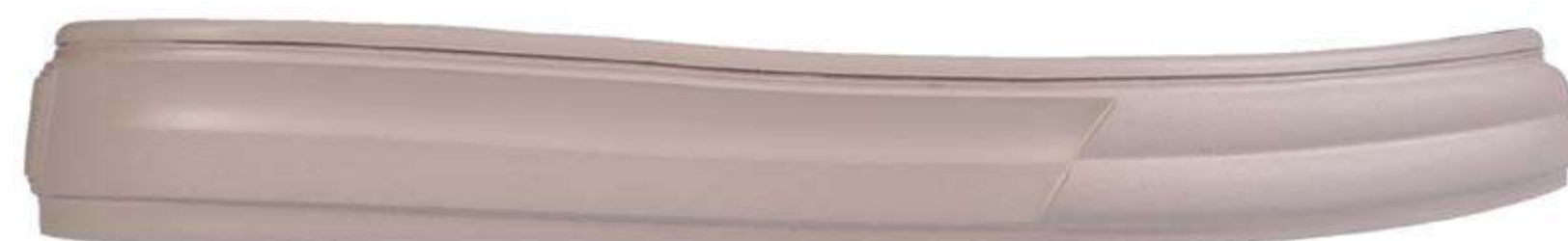
беж. 45 (1.4)/слід шерш./праймер