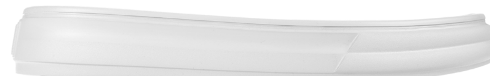
бел.45 (1.4)/слід шерш./праймер