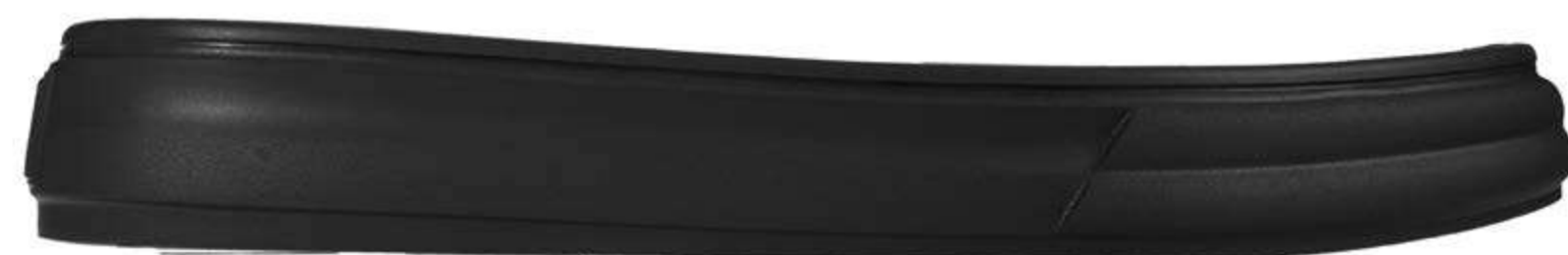
черн.45 (1.4)/слід шерш./праймер