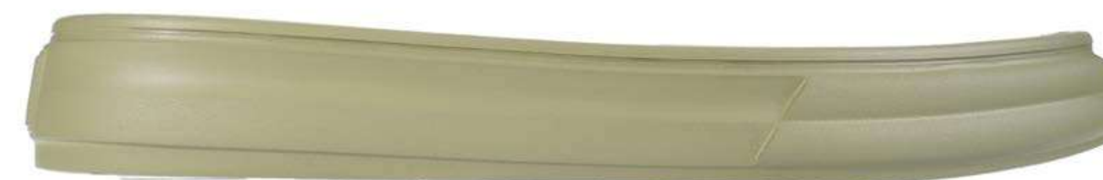
авокадо 45 (1.4)/слід шерш./праймер